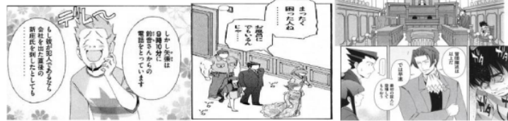
Figure 19 Giyougo “デレデレ” Figure 20 Giyougo “ゾロゾロ” Figure 21 Giyougo “ガタガタ”