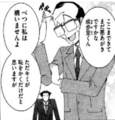
Figure 34 Giyougo “バチン”