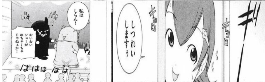
Figure 28 Giyougo “バタバタ” Figure 29 Giyougo “キョロキョロ”