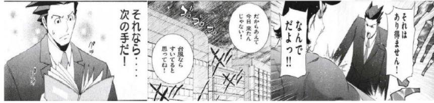
Figure 4 Giongo "パラパラ"