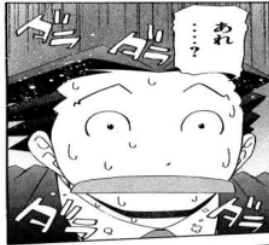
Figure 33 Giyougo “ダラダラ”