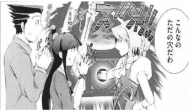
Figure 31 Giyougo “バチバチ”