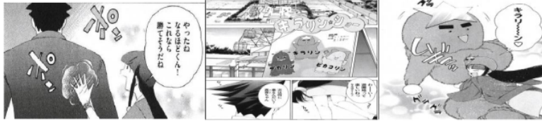
Figure 22 Giyougo “ポンポン” Figure 23 Giyougo “シンシン” Figure 24 Giyougo “ムギョツ”