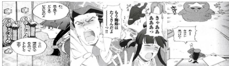
Figure 14 Gitaigo "ピカピカ"