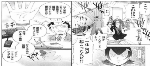
Figure 12 Giseigo "ガーガー"