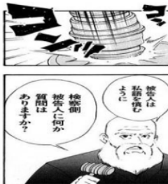
Figure 1 Giongo “コンコン”