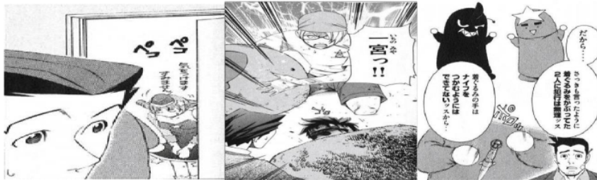
Figure 25 Giyougo “ペコペコ” Figure 26 Giyougo “ゴロゴロ” Figure 27 Giyougo “ポロッ”