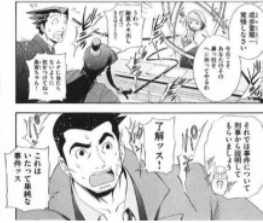
Figure 32 Giongo “パンパン”