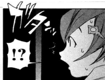
Figure 3 Giongo “ガタガタ”