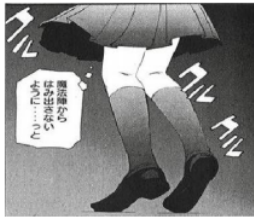
Figure 30 Giyougo “クルクル”