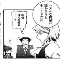
Figure 35 Giyougo “ジー”