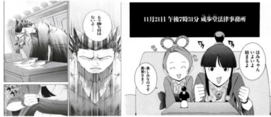
Figure 17 Giseigo “ググ” Figure 18 Gijougo “ワクワク”