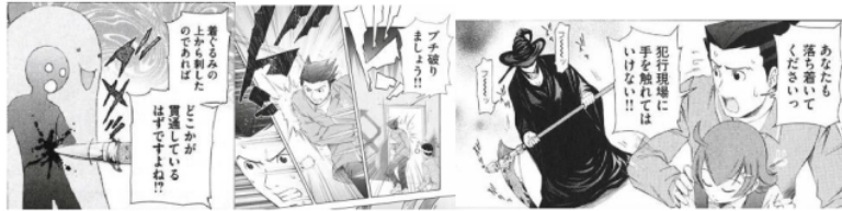
Figure 7 Giongo "グサッ"