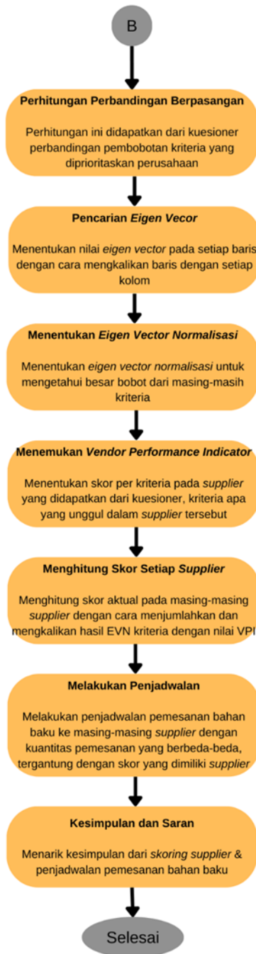
Gambar 1. Flowchart Penelitian

Pada metode penelitian ini dibagi beberapa tahapan, yang pertama merumuskan masalah yang ditemukan di perusahaan, yaitu merumuskan masalah terkait skoring supplier dan penjadwalan bahan bakunya sesuai dengan skor supplier. Yang kedua, yaitu tahap studi Pustaka untuk menambah literatur dan studi lapangan untuk meneliti data pendukung. Yang ketiga, yaitu pengumpulan data yang dibutuhkan untuk penelitian. Yang keempat, yaitu pemberian kuesioner kepada pihak logistic dan pengadaan bahan baku. Yang kelima, yaitu mulainya pengolahan data, dimana menghitung perbandingan berpasangan antar matrix, lalu mencari eigen vector dan eigen vector normalisasi, lalu menghitung skor setiap supplier