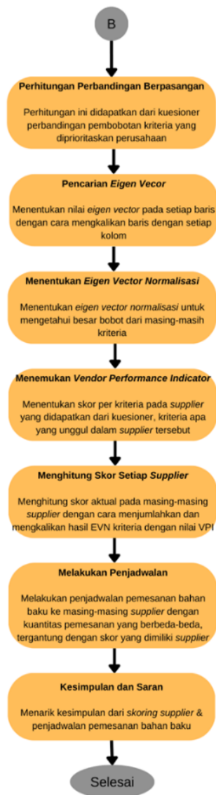
Gambar 1. Flowchart Penelitian

Pada metode penelitian ini dibagi beberapa tahapan, yang pertama merumuskan masalah yang ditemukan di perusahaan, yaitu merumuskan masalah terkait skoring supplier dan penjadwalan bahan bakunya sesuai dengan skor supplier. Yang kedua, yaitu tahap studi Pustaka untuk menambah literatur dan studi lapangan untuk meneliti data pendukung. Yang ketiga, yaitu pengumpulan data yang dibutuhkan untuk penelitian. Yang keempat, yaitu pemberian kuesioner kepada pihak logistic dan pengadaan bahan baku. Yang kelima, yaitu mulainya pengolahan data, dimana menghitung perbandingan berpasangan antar matrix, lalu mencari eigen vector dan eigen vector normalisasi, lalu menghitung skor setiap supplier