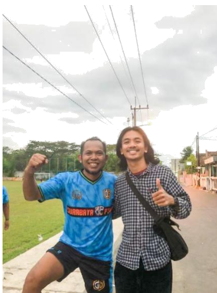
Gambar 23. Dokumentasi Dengan