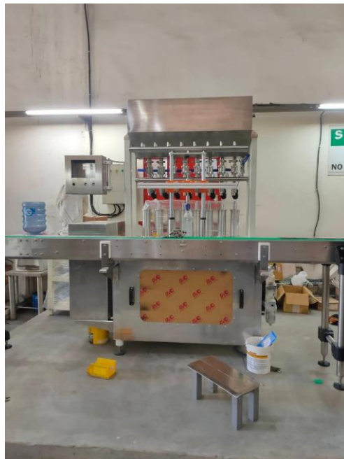
Gambar Lampiran 1 Produksi Mesin Filling