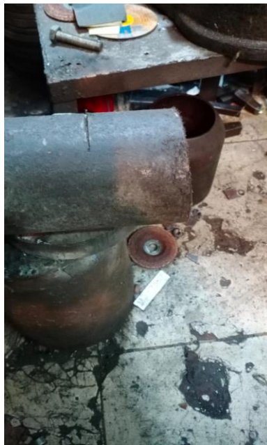
Gambar Lampiran 5 Jenis Kecacatan