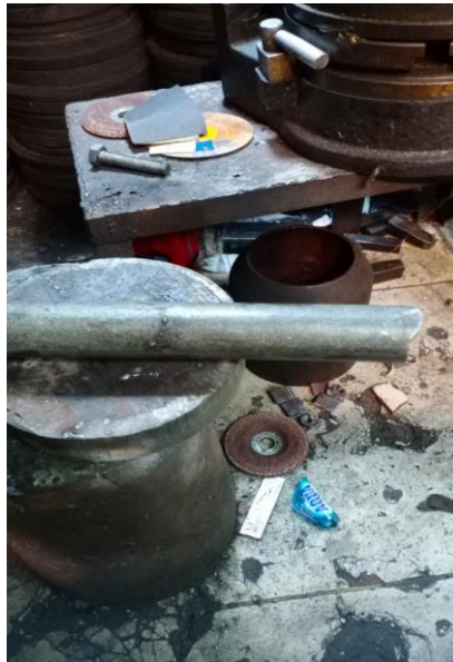
Gambar Lampiran 4 Jenis Kecacatan