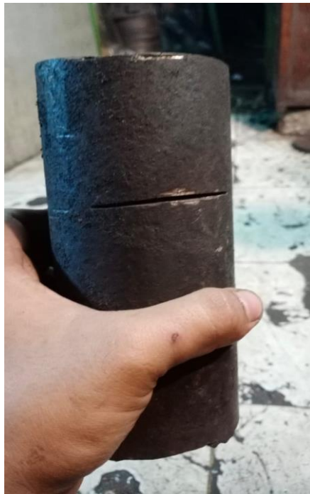
Gambar Lampiran 3 Jenis Kecacatan