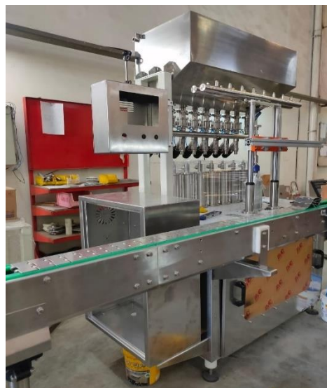
Gambar Lampiran 1 Produksi Mesin Filling