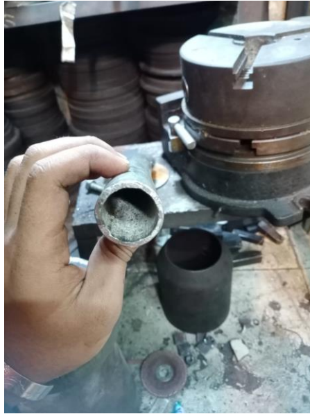
Gambar Lampiran 2 Jenis Kecacatan