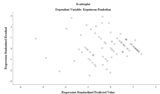
Gambar 4.2 hasil uji heteroskedastisitas