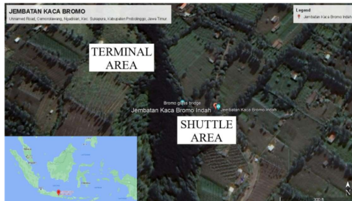
Gambar 3. Peta Lokasi Proyek Penerapan Terbatas Jembatan Kaca