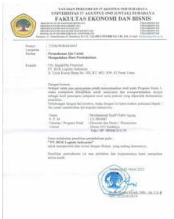
Lampiran 1. 10 Surat keterangan izin penelitian