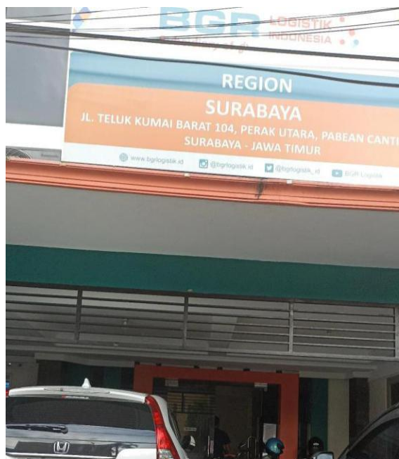
Lampiran 1. 11 Kantor PT. BGR Logistik Indonesia Surabaya