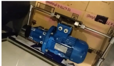
Gambar 3 Pergantian Bearing Pada Dinamo

Pada gambar di atas, dilakukan pergantian bearing pada dynamo penggerak barrel untuk meningkatkan kinerja sistem gerakan pada barrel. Tujuannya adalah untuk mengurangi kemungkinan terjadinya first crack pada biji kopi robusta Arjuno selama proses roasting.