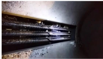
Gambar 4 Pergantian Burner Head Pada Mesin Roasting

Dalam ilustrasi di atas, dilakukan pergantian pada head burner yang terletak pada penghantar panas. Hal ini dilakukan untuk memaksimalkan panas yang dihasilkan dalam proses roast biji kopi, sehingga tingkat roasting menjadi lebih merata. Dengan penggerak barrel yang telah