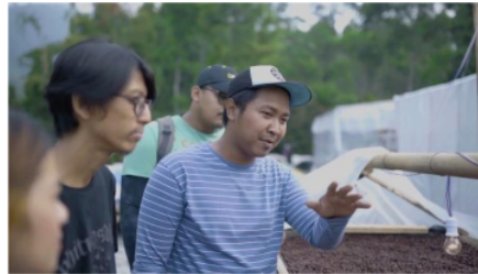
Gambar 5 Pemasangan Paranet Pada Proses Paska Panen

Dalam implementasi perbaikan, dilakukan pemasangan paranet pada proses paska panen guna mengurangi intensitas panas yang berlebihan. Selain itu, juga diterapkan kontrol yang lebih intensif pada proses produksi, terutama pada proses paska panen, dengan tujuan untuk mengurangi kemungkinan terjadinya cacat pada biji kopi.