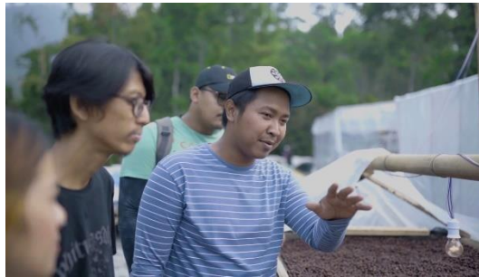
Gambar 5 Pemasangan Paranet Pada Proses Paska Panen

Dalam implementasi perbaikan, dilakukan pemasangan paranet pada proses paska panen guna mengurangi intensitas panas yang berlebihan. Selain itu, juga diterapkan kontrol yang lebih intensif pada proses produksi, terutama pada proses paska panen, dengan tujuan untuk mengurangi kemungkinan terjadinya cacat pada biji kopi.