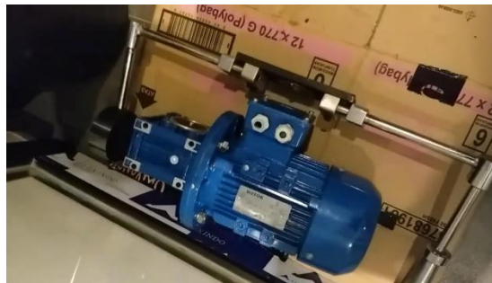
Gambar 3 Pergantian Bearing Pada Dinamo

Pada gambar di atas, dilakukan pergantian bearing pada dynamo penggerak barrel untuk meningkatkan kinerja sistem gerakan pada barrel. Tujuannya adalah untuk mengurangi kemungkinan terjadinya first crack pada biji kopi robusta Arjuno selama proses roasting.