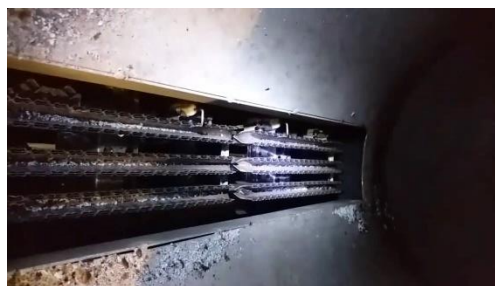
Gambar 4 Pergantian Burner Head Pada Mesin Roasting

Dalam ilustrasi di atas, dilakukan pergantian pada head burner yang terletak pada penghantar panas. Hal ini dilakukan untuk memaksimalkan panas yang dihasilkan dalam proses roast biji kopi, sehingga tingkat roasting menjadi lebih merata. Dengan penggerak barrel yang telah