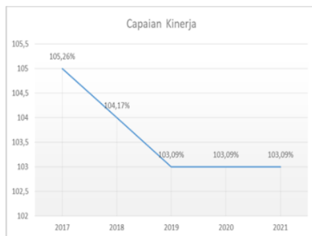
Gambar 1.1 Grafik Capaian Kinerja

Kinerja atau prestasi kerja merupakan hasil kerja yang telah dicapai oleh seseorang berdasarkan tingkah laku kerjanya dalam menjalankan aktivitas dalam bekerja (Sutrisno, 2016:151). Berhasil atau tidaknya organisasi dalam melaksanakan tugas sangat berhubungan dengan kinerja karawan dan capaian kerja pada suatu organisasi adalah faktor penting yang wajib diperhatikan guna mewujudkan instansi dalam mencapai tujuan yang sudah ditetapkan.