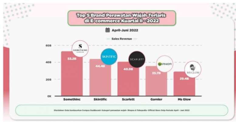
Gambar 1.1 Data Top 5 brand Skincare Wajah