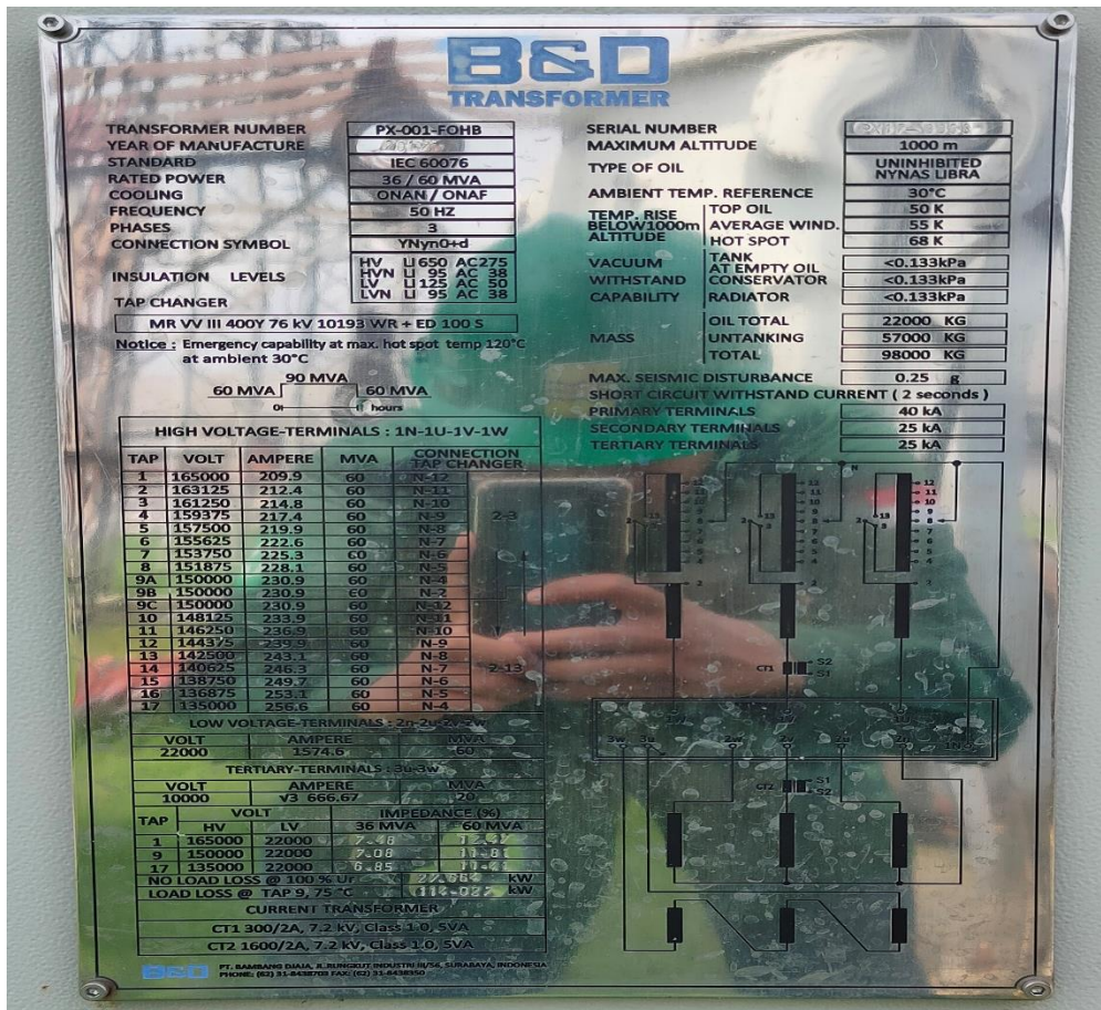
Spesifikasi Transformator 6