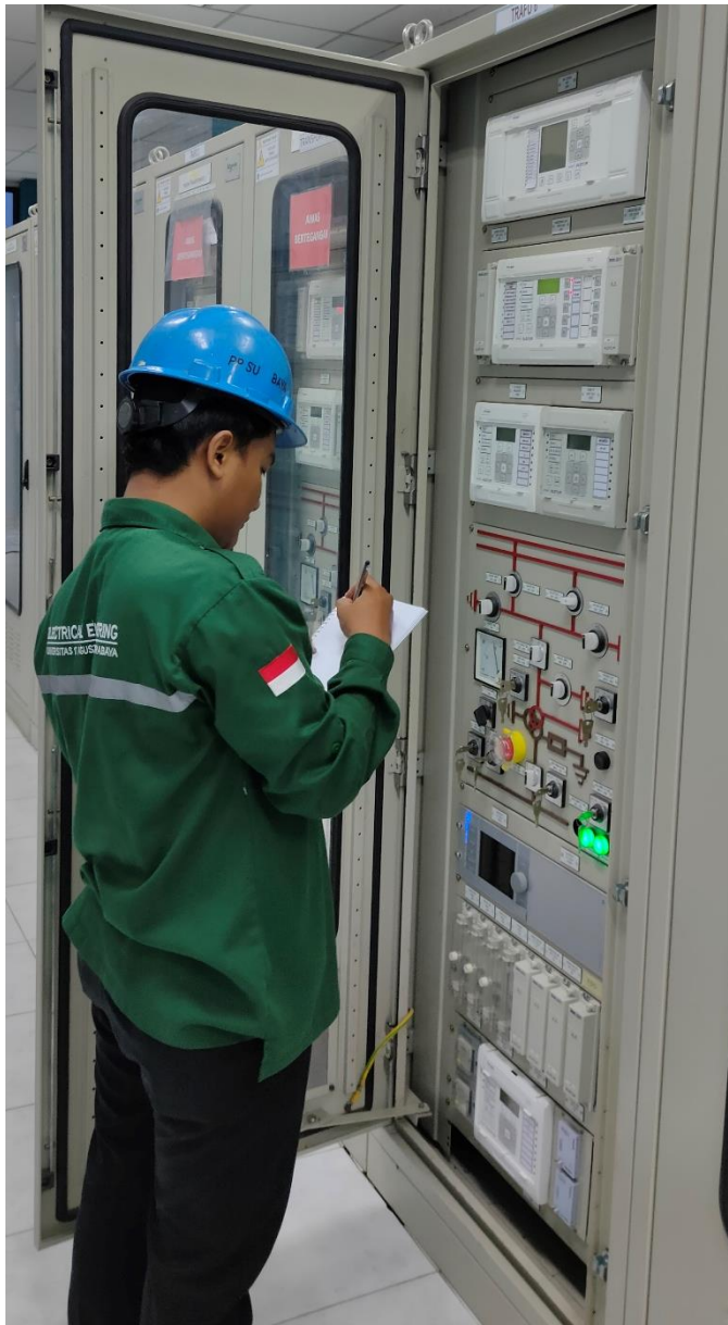
Dokumentasi Pencatatan Relai OCR