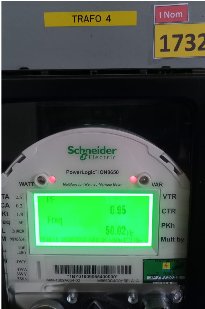
Cos Phi Transformer 4