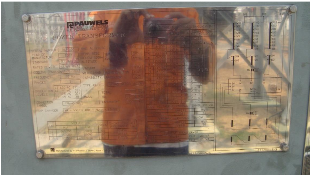
Spesifikasi Transformator 4