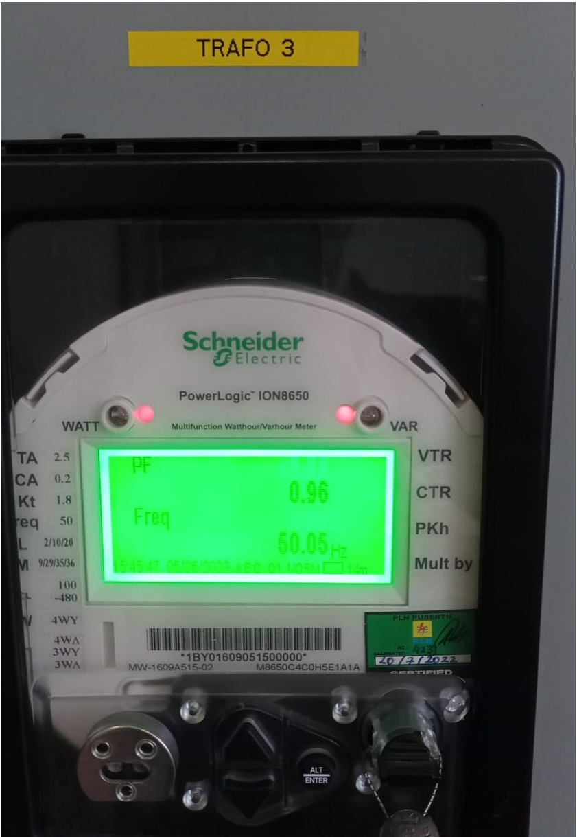
Cos Phi Transformator 3