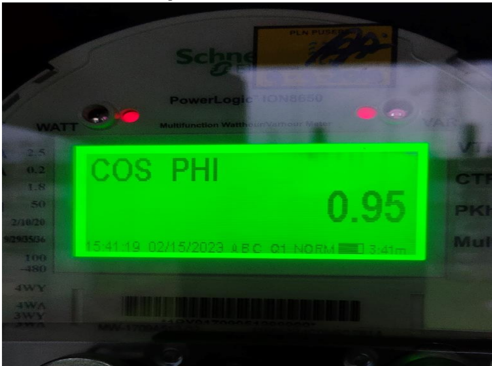
Cos Phi pada Transformator 6