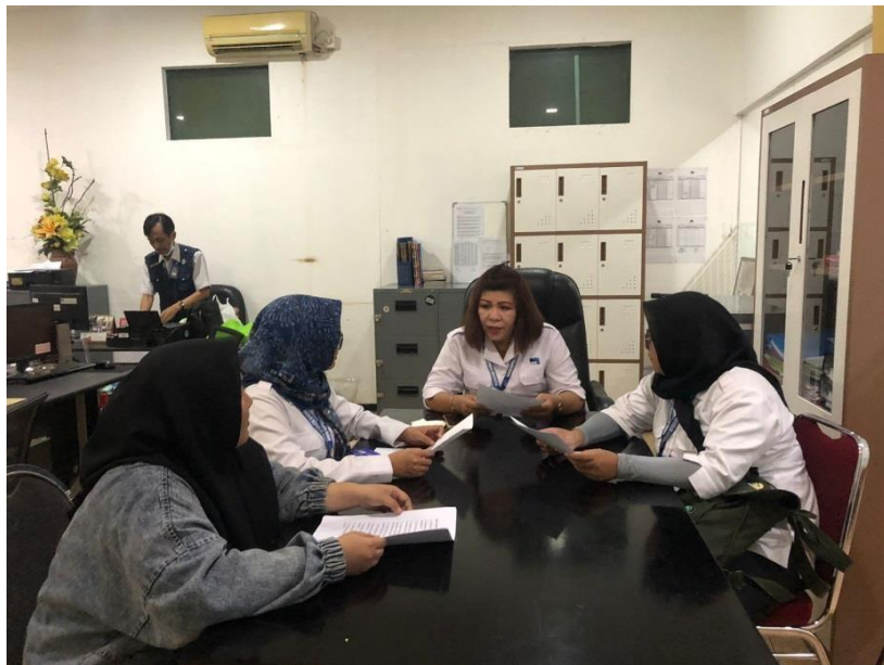
Foto Hasil Wawancara bersama Penanggung Jawab di RRI PRO 2 Surabaya