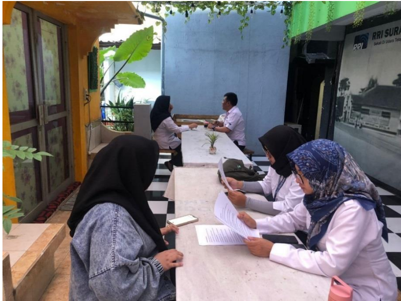
Foto Hasil wawancara bersama Penyiar dan Tim Kreatif