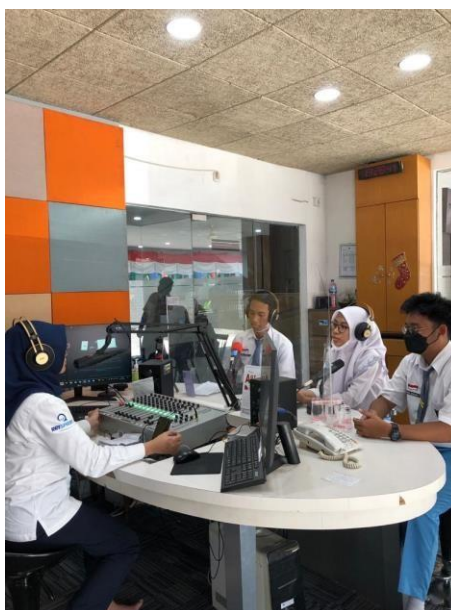
Hasil foto saat penyiar melakukan live streaming dengan salah satu murid dari SMA Negeri 2 Surabaya