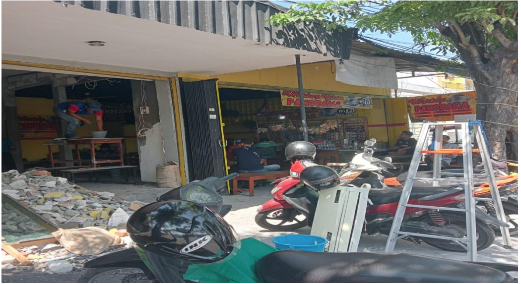
6. Bapak Arifudin