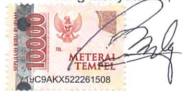
(Rendy Fadila Ajiputra)