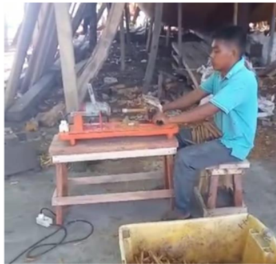
Gambar 3. Proses Pembentukan Pasak Setelah Perancangan

Setelah dilakukan perancangan alat maka langkah selanjutnya uji coba alat untuk mengetahui apakah alat yang telah dirancang berhasil memenuhi tujuan dari penelitian. Berikut adalah kegiatan operasional menggunakan alat pembentukan pasak kayu setelah perancangan seperti yang tertera pada Gambar di bawah ini: