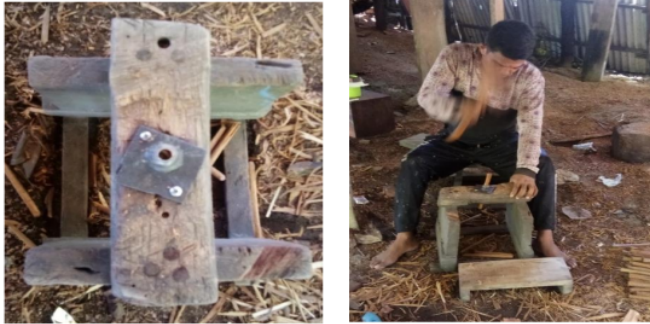
Gambar 1. Alat dan Proses Pembentukan Pasak Kayu

Dalam kondisi tersebut diperlukan suatu alat untuk memudahkan operator dalam proses pembentukan pasak kayu sehingga tidak terlalu banyak menguras tenaga dan bisa menurunkan tingkat kelelahan guna meningkatkan produktivitas kerja. Prinsip kerja alat pembentuk pasak kayu ini menyerupai prinsip kerja penyerut pensil.