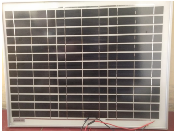
Gambar 3 Solar cell

Solar Cell adalah suatu perangkat atau komponen yang dapat mengubah energi cahaya matahari menjadi energi listrik dengan menggunakan prinsip efek Photovoltaic. Photovoltaic adalah suatu fenomena dimana munculnya tegangan listrik karena adanya hubungan atau kontak dua elektroda yang dihubungkan dengan sistem padatan atau cairan saat mendapatkan energi cahaya. Oleh karena itu, Sel Surya atau Solar Cell sering disebut juga dengan Sel Photovoltaic (PV). Efek ini ditemukan oleh Henri Becquerel pada tahun 1839.