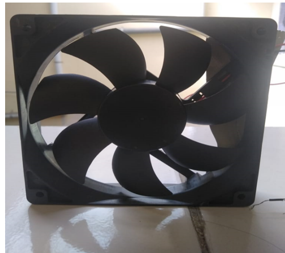
Gambar 2 Fan

Digunakan untuk menghasilkan angin, fungsi yang umum adalah untuk pendingin udara, penyegaran udara, ventilasi (exhaust fan), pengering (umumnya memakai komponen penghasil panas). Fan (Kipas) juga ditemukan dimesin penyedot debu dan berbagai ornamen untuk dekorasi ruangan.