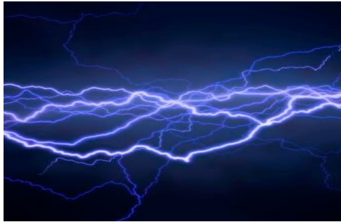
Gambar 6. Arus listrik

Arus listrik dapat didefinisikan sebagai muatan listrik yang mengalir per satuan waktu. Arus listrik terdiri atas dua jenis, yaitu arus listrik searah (DC = Direct Current ) dan arus listrik bolak-balik (AC = Alternating Current ).