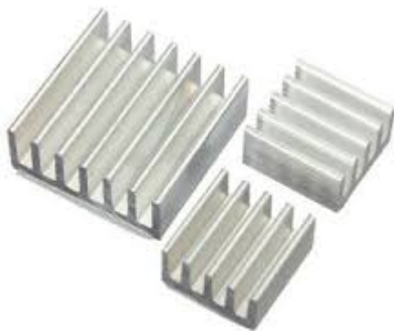
Gambar 4 Heatsink Aluminium

Heatsink adalah logam dengan design khusus yang terbuat dari aluminium(Al) atau tembaga(Cu)(bisa merupakan kombinasi dari kedua material tersebut) yang berfungsi untuk memperluas transfer panas dari prosesor.