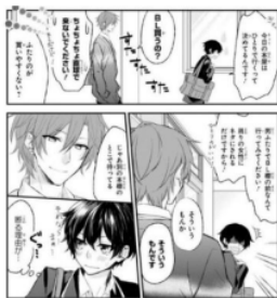
Gambar Data 3