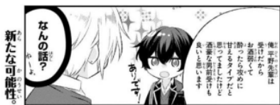
Gambar Data 10

宮野 : 【俺、平野先輩は受けだからお酒弱くて酔ったら攻めに甘えるタイプだと思ってましたけど、酒豪な男前受けも良いと思います】