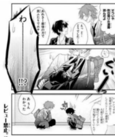
Gambar Data 2

Data 2 : Fudanshi menyembunyikan identitas dengan tidak membahas manga BL di tempat yang ramai