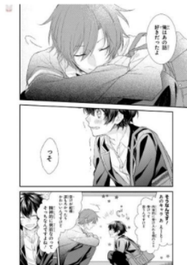
Gambar Data 7