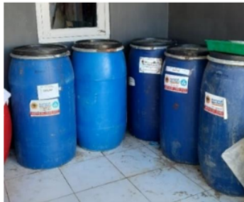
Gambar 1. Alat Manual Proses Fermentasi Nutrisi Organik

Nutrisi organik tergolong sebagai pengganti pupuk yang murah, mudah dibuat dan dapat meningkatkan hasil panen. Dalam proses pembuatan nutrisi organik terdapat beberapa proses yaitu proses pencacahan, pemerasan, dan fermentasi. Permasalahan yang dihadapi para petani adalah proses fermentasi nutrisi yang cukup lama yaitu 16-30 hari disebabkan proses fermentasi yang dilakukan masih manual menggunakan drum plastik berkapasitas 150 liter.