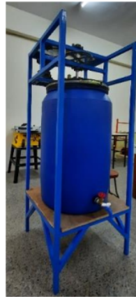
Gambar 2. Alat Bioreaktor Anaerob

Alat Bioreaktor Anaerob terbuat dari drum plastik berkapasitas 200 liter sebagai tempat fermentasi dan besi hollow 3x3 cm sebagai rangka penopang drum dengan masa umur pakai alat yaitu 3 Tahun. Dalam pengoprasian alat ini terdapat 2 mode yaitu mode manual dan otomatis, mode manual merupakan mode dimana pengaduk pada alat berputar untuk mengaduk bahan baku yang ada pada dalam drum, apabila proses pengadukan selesai maka mode manual harus dimatikan. Sedangkan mode otomatis merupakan mode dimana pengaduk dan pemanas hidup secara otomatis sesuai dengan setingan suhu yang ditentukan, jika suhu yang ditentukan sudah memenuhi maka pengaduk dan pemanas otomatis akan berhenti dan begitu pula sebaliknya apabila suhu tidak sesuai dengan yang ditentukan maka otomatis pengaduk dan pemanas nyala secara otomatis.