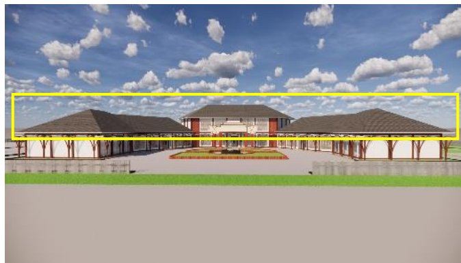
Gambar 4. Atap Bangunan