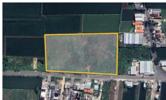
Gambar 2. Lokasi Perancangan

Perancangan Fasilitas Pengembangan UMKM Bidang Kuliner ini berada di Kabupaten Lamongan. Kabupaten Lamongan sendiri memiliki luas wilayah \pm 1.752,21 km 2 atau setara dengan 175.221 Ha atau \pm 3,67\% dari luas wilayah Provinsi Jawa Timur.