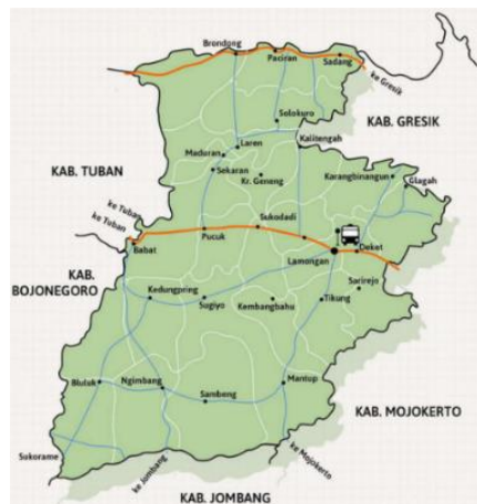
Gambar 1. Peta Kabupaten Lamongan

Perancangan Fasilitas Pengembangan UMKM Bidang Kuliner ini berada di Kabupaten Lamongan. Kabupaten Lamongan sendiri memiliki luas wilayah \pm 1.752,21 km 2 atau setara dengan 175.221 Ha atau \pm 3,67\% dari luas wilayah Provinsi Jawa Timur.