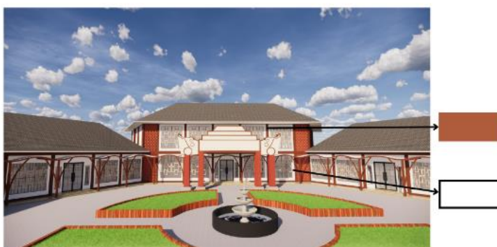
Gambar 7. Warna Bangunan

Arti didalam suatu penggunaan warna kontras adalah perpaduan dimana warna yang berbeda dapat melengkapi hingga mengisi bangunan dengan tetap memiliki keharmonisan didalam pandangan warna. Sedangkan untuk penggunaan warna yang kuat itu sendiri bertujuan agar dimana bangunan itu terlihat memiliki kesan yang sangat dalam. Karena warna nantinya akan menjadi satu bagian yang dapat mampu mempengaruhi akan suatu adanya arsitektur neo vernakular. Karena warna yang akan digunakan nanti akan menjadikan penguat bagi suatu nilai didalam aspek kebudayaan dan juga aspek modern yang akan dikombinasikan ke dalam konsep neo venakular.