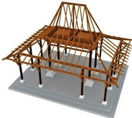
Gambar 3. Rangka Atap Rumah Joglo

Diketahui dari penjelasan sebelumnya bahwasannya arsitektur neo vernakular ini menggunakan konsep yang secara langsung menggabungkan kedua konsep arsitektur modern dan juga arsitektur tradisional. Sehingga ada beberapa penerapan yang akan dilakukan untuk bangunan dalam fasilitas pengembangan UMKM bidang kuliner di kabupaten Lamongan. Dari bangunan ini terlihat bahwa pada atap bangunan adalah salah satu bentuk pengulangan perwujudan yang menggunakan material atap pelana dimana atap ini tentu sudah menjadi ciri khas tersendiri seperti pada rumah-rumah yang terbangun di Indonesia dan terkhusus di Kabupaten Lamongan.