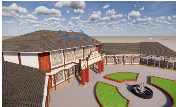
Gambar 5. Sirkulasi Air Hujan

Menurut pendapat yang dikemukakan oleh (Zikri, 2012) bahwasannya suatu bangunan yang menggunakan konsep arsitektur Neo Vernakular adalah bangunan yang secara langsung mengangkat adanya penerapan dalam pembangunan dengan unsur budaya, selain itu juga terdapat pemfokusan terhadap (tata letak denah, detail dan juga struktur maupun ornamen) sehingga dalam penggunaan atap yang dibentuk dengan penggunaan atap pelana akan memungkinkan air hujan yang berada diatas atap akan lebih cepat turun ke bawah permukaan tanah. Untuk keadaan Indonesia memiliki nilai kuantitas keberadaan curah hujan yang sangat tinggi dalam hal ini tentu saja penggunaan atap pelana lebih cepat merespon akan adanya keberadaan iklim.