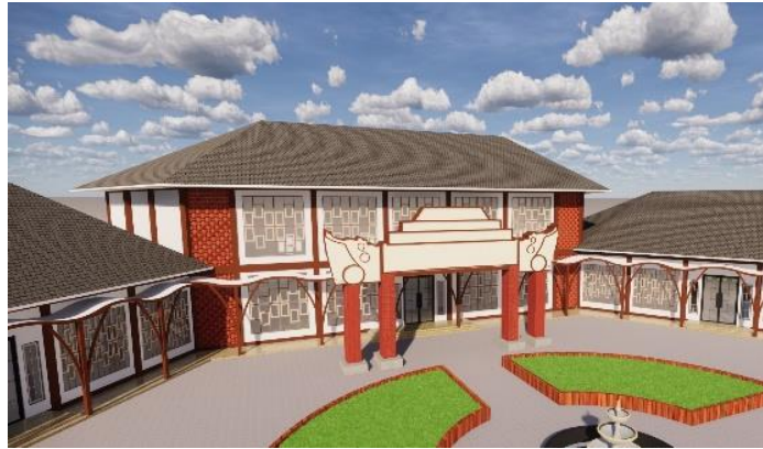
Gambar 9. Warna Bangunan

warna coklat nantinya juga akan digunakan untuk kusen jendela. Sehingga akan memperlihatkan unsur budaya yang lebih khas dengan perpaduan yang modern akan terlihat di Fasilitas UMKM pada bidang kuliner di kabupaten Lamongan ini.