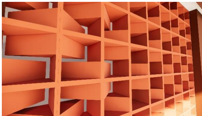
Gambar 10. Roster

Fasilitas Pengembangan UMKM Bidang Kuliner yang bertempat pada kabupaten Lamongan nantinya akan secara langsung akan memilih material yaitu beton dan galvalum. Sehingga beton dan galvalum akan menjadi material prioritas atau utama yang mana akan juga dipadukan oleh adanya suatu dinding bata, kaca bahkan roster.