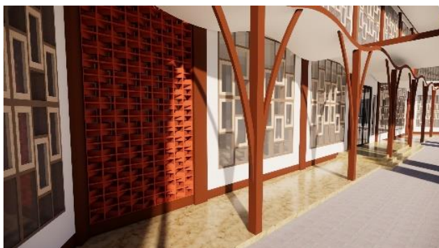
Gambar 6. Sirkulasi Udara melalui Roster dan jendela

Fasilitas untuk Pengembangan UMKM Bidang Kuliner yang didirikan di Kabupaten Lamongan akan melaksanakan perancangan yang secara optimal menggunakan pengudaraan yang alami yaitu menggunakan banyak bukaan. Sehingga nanti sirkulasi yang ada pada udara akan memanfaatkan sistem cross ventilation yaitu dengan membuat banyak bukaan-bukaan seperti pintu, jendela, dan roster.