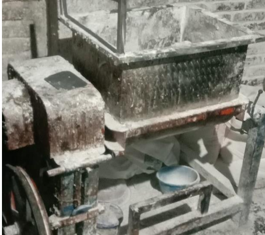
Mesin Molen (Adonan)