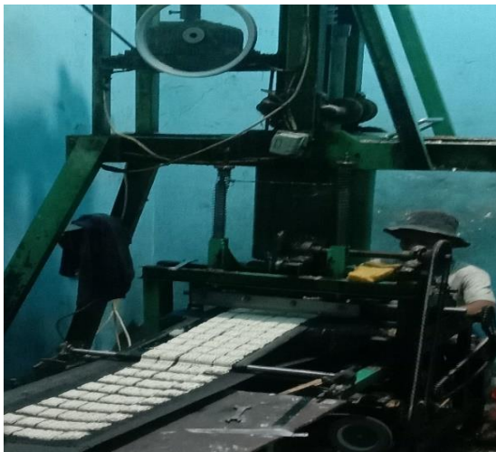
Proses Cetak Kerupuk Kotak (Mesin Cetak)