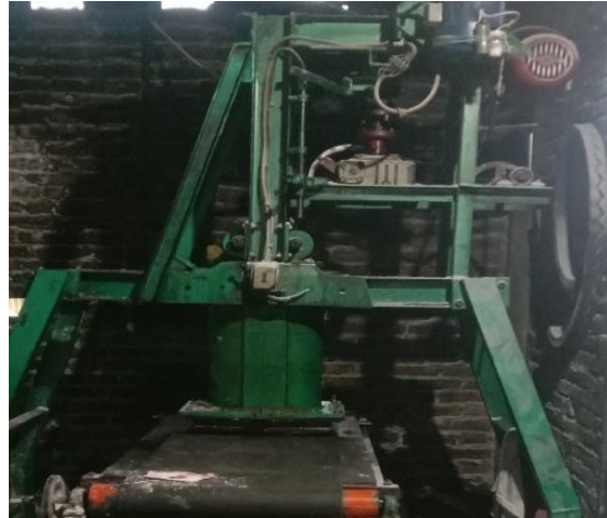
Mesin Cetakan (Kerupuk Bulat)