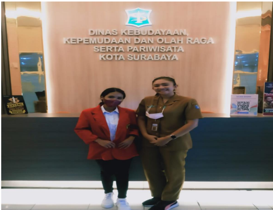
Foto bersama Kepala Bidang Pariwisata