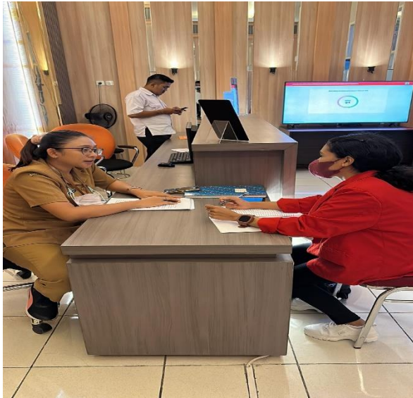
Wawancara dengan Kepala Bidang Pariwisata