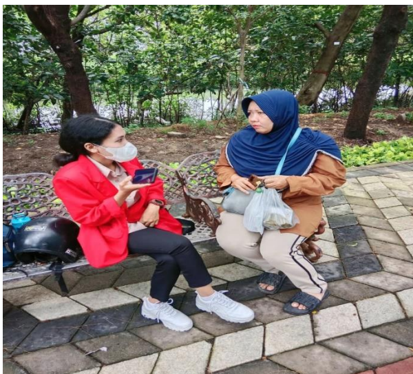
Wawancara dengan pengunjung Kebun Raya Mangrove Gunung Anyar