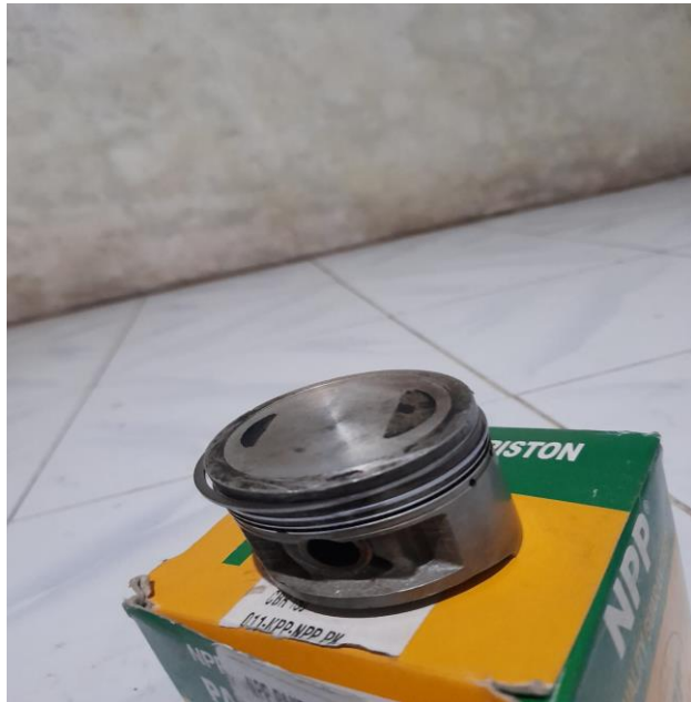
Gambar Piston 52mm