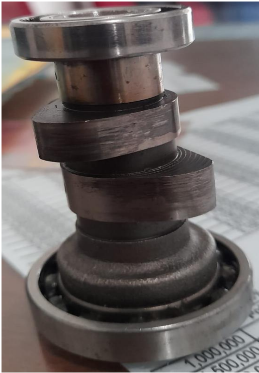
Gambar Camshaft Standar