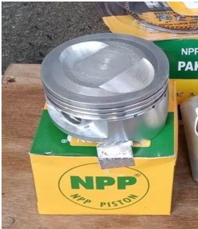
Gambar Piston 55,5mm