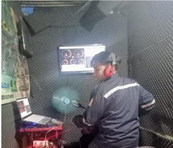
Proses uji Dynotest