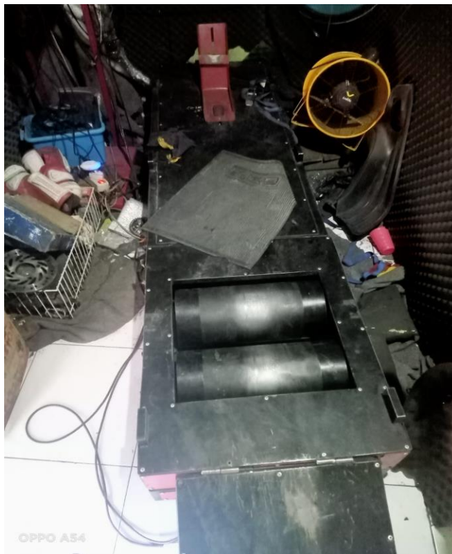
Alat Uji Dynotest