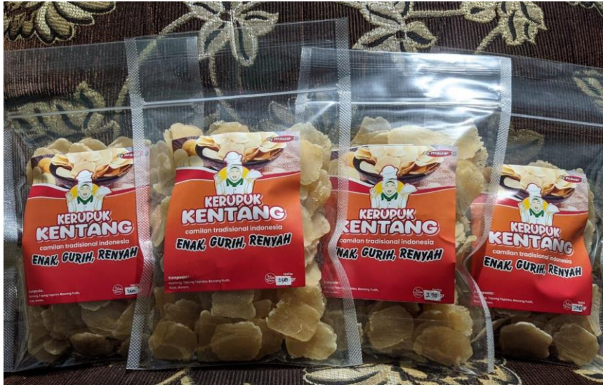
Produk Krupuk Kentang Kelompok Usaha Mawar