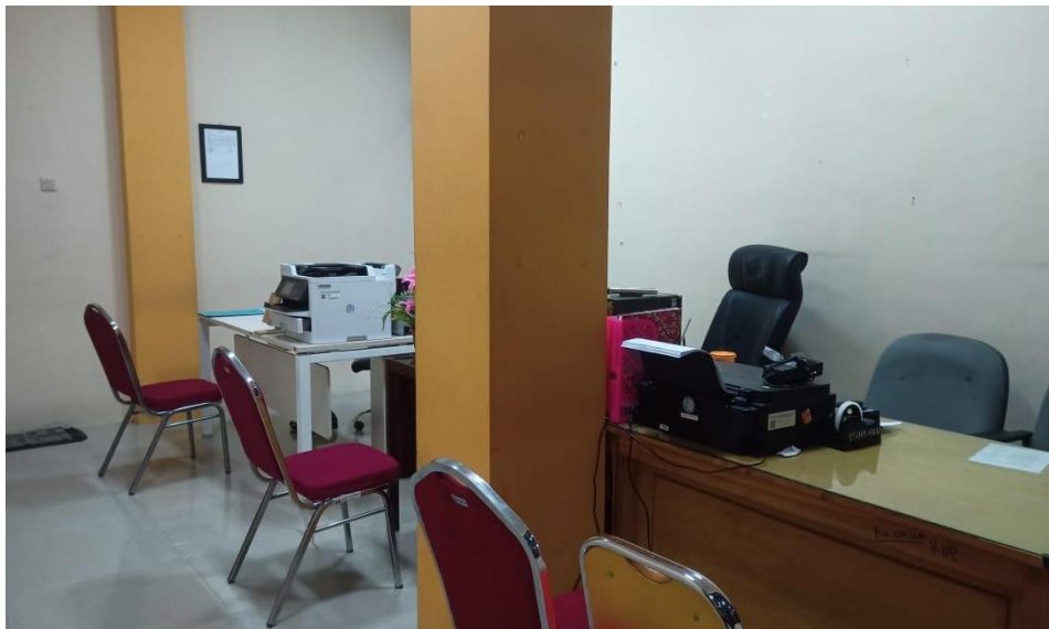
Gambar Ruang Pelayanan Bidang Pemberdayaan UM Dinas Koperasi dan UM Sidoarjo