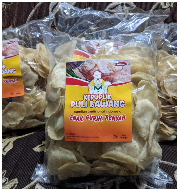
Produk Krupuk Puli Kelompok Usaha Mawar