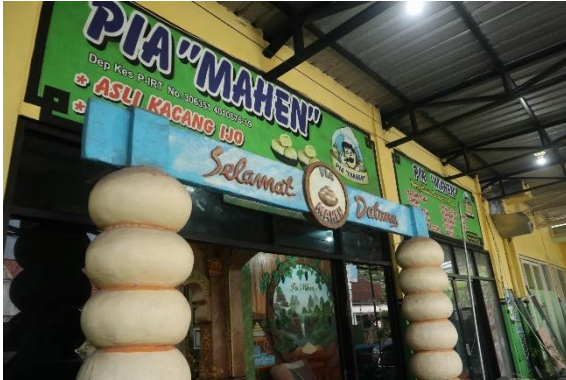
Lampiran 2 : Foto Bersama pemilik UMKM Pia "Mahen" (Bu Srinah)