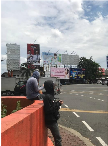
Perhitungan Arus Kendaraan Pada hari Rabu 22 Maret 2023