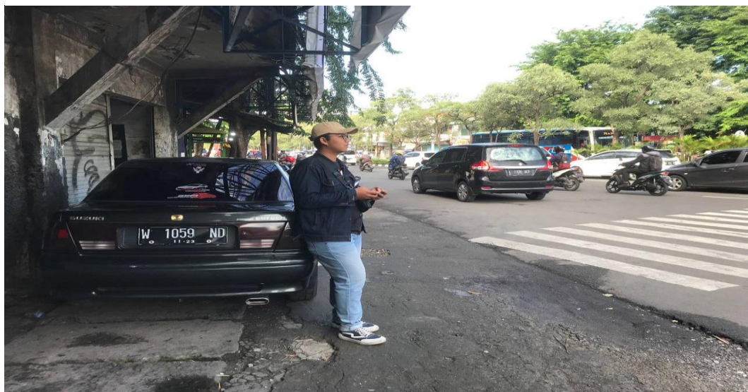
Perhitungan Arus kendaraan pada Hari Selasa, Tanggal 21 Maret 2023