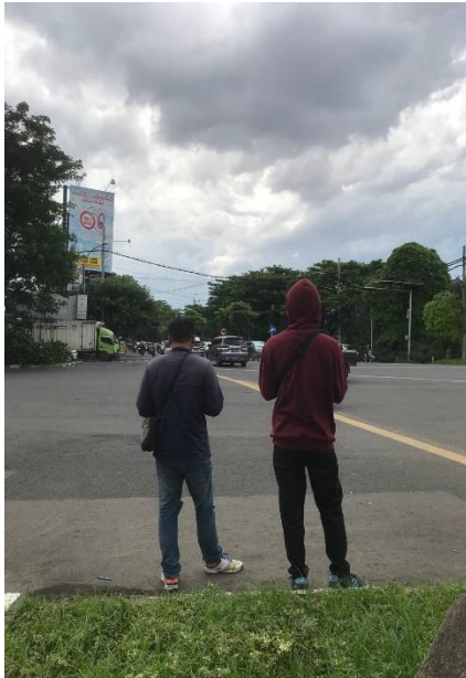
Perhitungan Arus Kendaraan Pada hari Rabu 22 Maret 2023