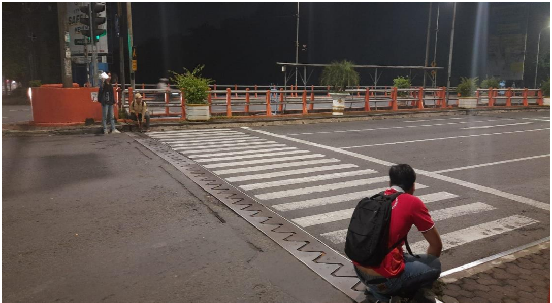
Pengukuran Lebar Jalan Pada Kamis Malam 24 Maret 2023