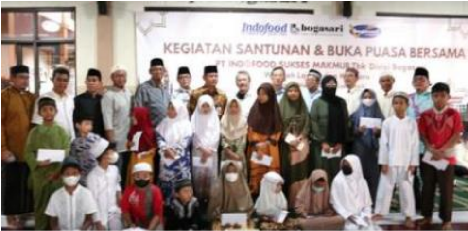
Program CSR Bogasari santunan anak yatim