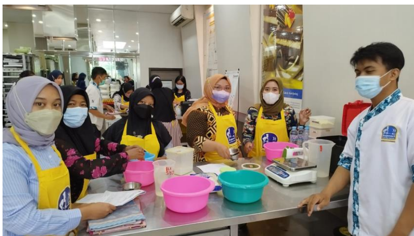
Program CSR Bogasari Surabaya pelatihan UMKM guna menghasilkan pebisnis baru