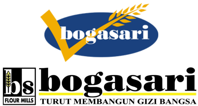
Logo PT. ISM Bogasari Flour Mills Surabaya