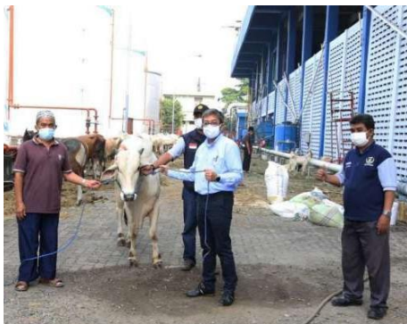
Sumbangan Hewan Qurban oleh Bogasari