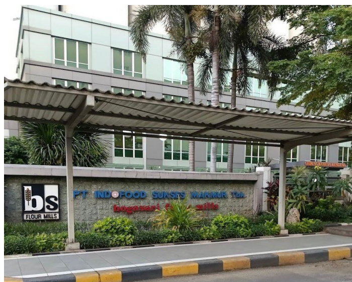
Gambar 9 Gedung PT. ISM Bogasari Flour Mills Surabaya