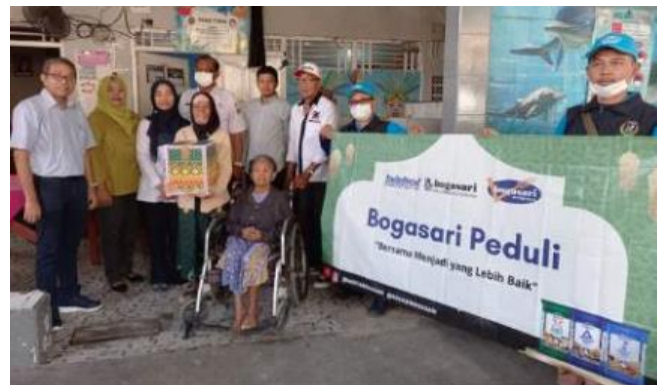
Kegiatan CSR Bogasari berbagi sembako kepada warga Kec. Pabean Cantikan