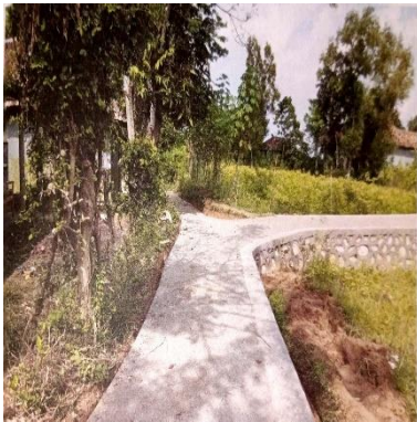
c. Rabat Beton Dusun Dalbaddung