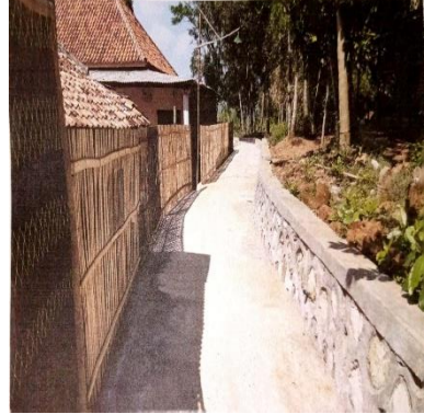
b. Rabat Beton Dusun Sarean