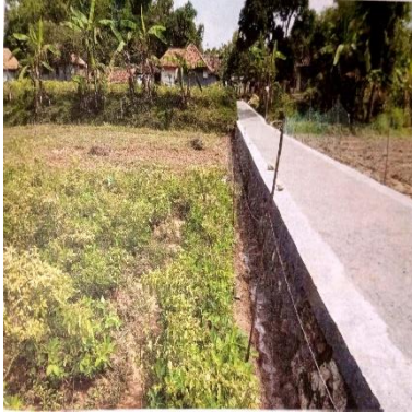
a. Plengsengan Dusun Sarean