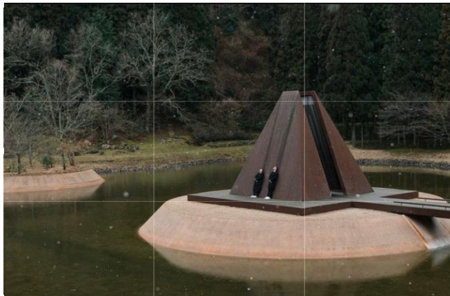
Foto Pre-Wedding dengan rule of thirds