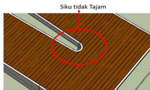
Gambar 3 sudut sirkulasi tidak tajam

Lansia mudah mengalami permasalahan kecil karena penurunan fisik yang terjadi mempengaruhi aktivitasnya hal ini berakibat fatal bagi lansia.