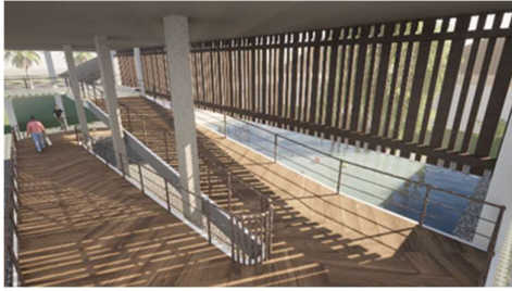
Gambar 5 Penerapan kisi-kisi pada ruangan