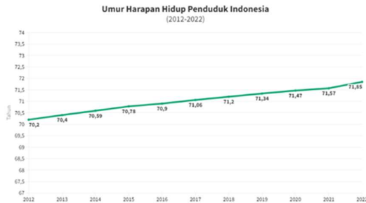
Gambar 2 Proyeksi Usia Harapan Hidup Indonesia tahun 2012-2022 Sumber : Badan Pusat Statistik

Pada tahun 2022, Usia Harapan Hidup (UHH) penduduk Indonesia mencapai 71,85 tahun. Kenaikan UHH tertinggi terjadi pada 2022 sebesar 0,28 tahun. Sedangkan, kenaikan UHH terendah terjadi pada 2021, yakni 0,1 tahun. Rata-rata kenaikan pertahunnya sebesar 0,17 tahun. Meningkatnya jumlah lansia setiap tahun secara otomatis berakibat pada bertambahnya jumlah rumah tangga dan fasilitas yang ditempati oleh lanjut usia.