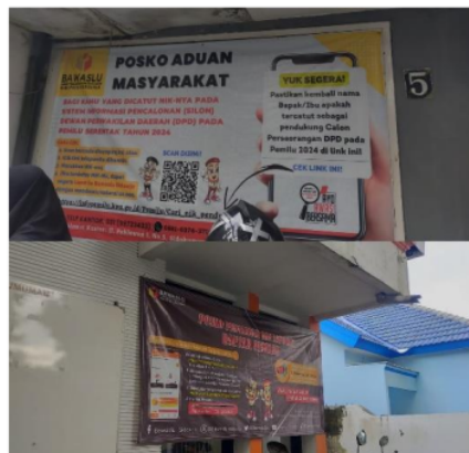
Gambar 4.3 Banner Posko “Jarimu Awasi Pemilu” Bawaslu Sidoarjo