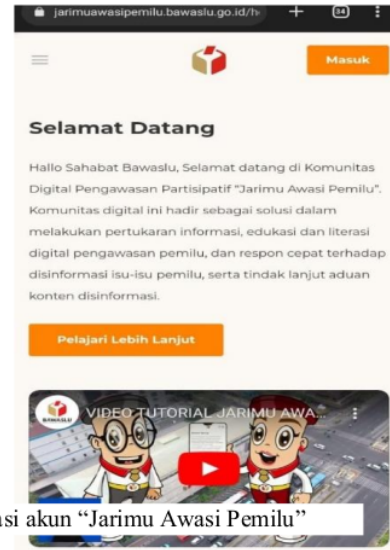
Gambar 4. 1 Pamflet dan Panduan registrasi akun “Jarimu Awasi Pemilu”