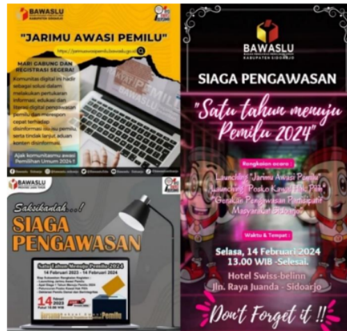
Gambar 4.2 Isi Pesan Instagram dan WhatsApp dari Bawaslu Kabupaten Sidoarjo