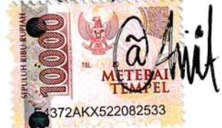
Azizah Fitri Azarah