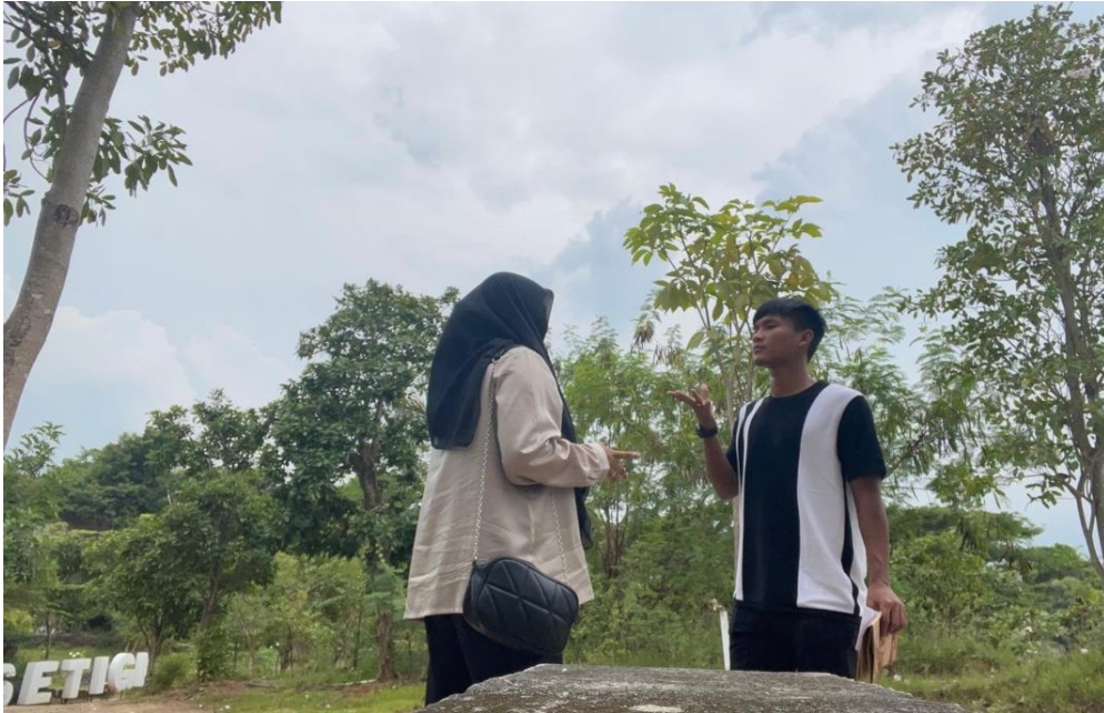
Dokumentasi bersama pengunjung Wisata Setigi