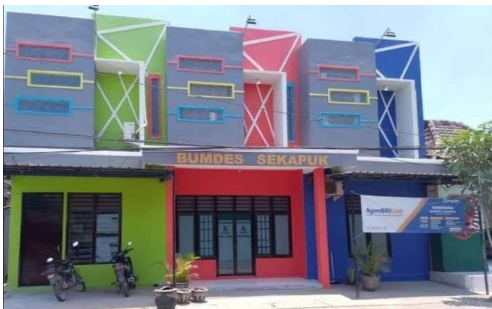
Dokumentasi kantor BUMDes Sekapuk