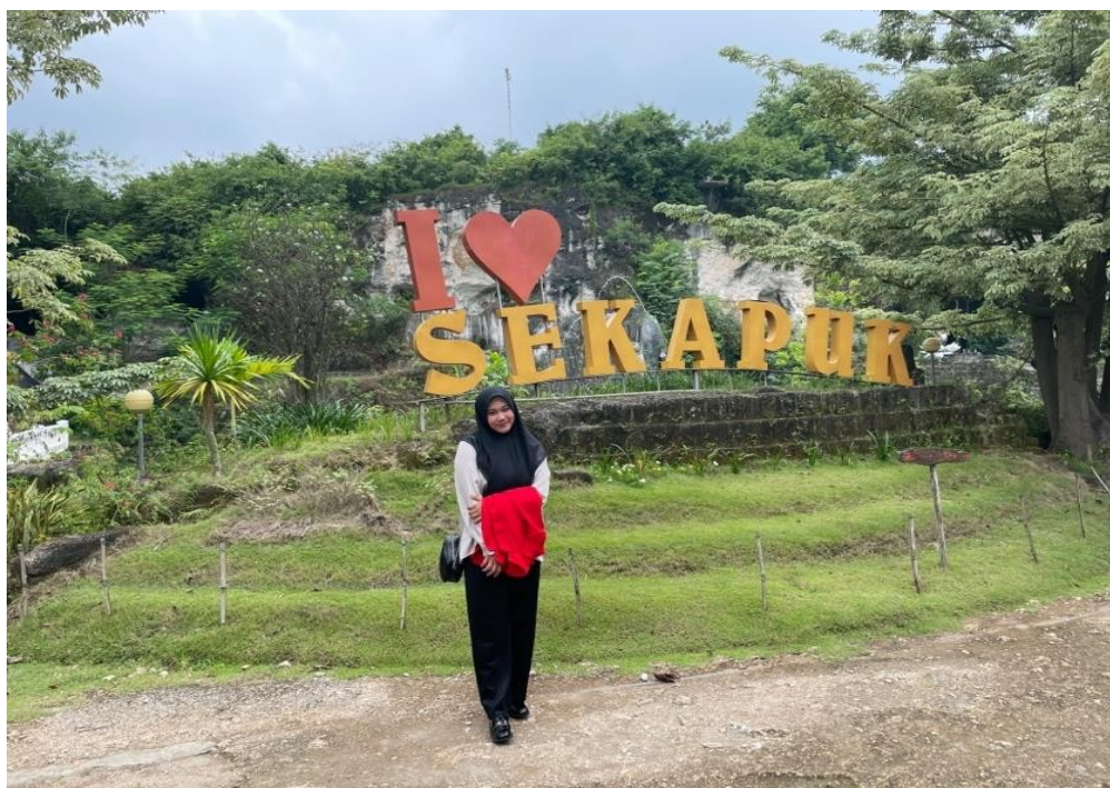
Foto tampak depan dari Wisata Setigi