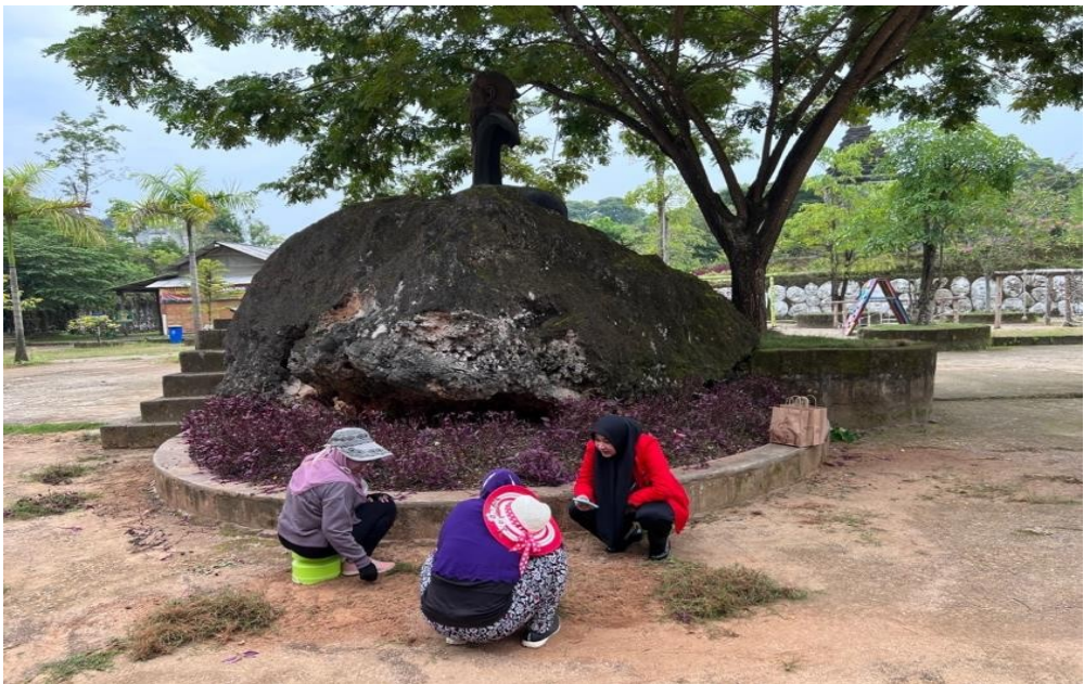
Dokumentasi wawancara bersama dengan pegawai di Wisata Setigi