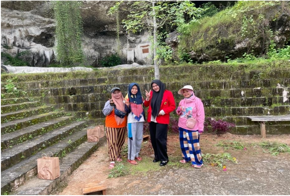
Dokumentasi dengan pedangan di Wisata Setigi