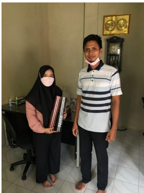
Lampiran 4 Gambar saat melakukan wawancara dengan pemilik