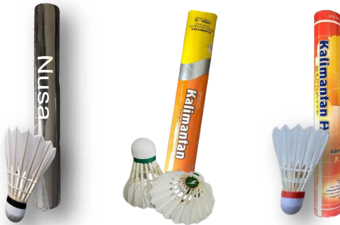
Lampiran 10 Gambar Bahan Baku