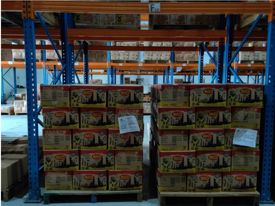
Gambar 6.1 Contoh barang dalam rak