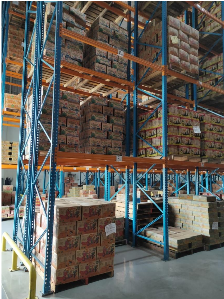
Gambar 6.3 Rak penyimpanan B