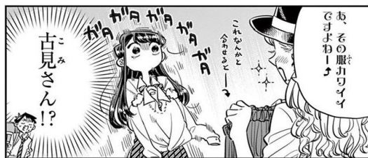
Gambar 7 Komi dihampiri oleh pegawai toko

Gambar di atas memperlihatkan onomatope “ガタガタ” yang mempunyai arti tubuh gemetar hebat karena kedinginan atau ketakutan. Yang di mana dalam hal ini merujuk kepada ketakutan, karena Komi tiba-tiba dihampiri oleh pegawai toko dan memberi rekomendasi setelan yang cocok saat Komi sedang memilih-milih baju. Ini merupakan salah satu ciri simtom somatic yang dipengaruhi rasa tertekan terhadap situasi sosial.