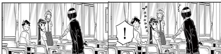
Gambar 6 Komi diajak bersalaman oleh Nakanaka

Data di atas menceritakan Nakanaka yang adalah seorang chuunibyoutu terpesona oleh kecantikan Komi pada pandangan pertama membuatnya ingin berteman dengan Komi. Saat jam istirahat Nakanaka pun menuju ke kelas Komi, dengan gaya khas chuunibyoutunya Nakanaka mengajak Komi untuk berteman. Tetapi Komi tidak hanya diam dan nampak gemetar saat Nakanaka mengajak berjabat tangan, seperti gambar berikut.