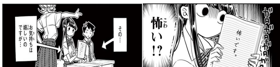
Gambar 10 Komi ketakutan saat diajak ke pasar

Scrip di atas menunjukkan bahwa Komi sempat menolak ajakan Najimi untuk pergi berbelanja baju bersama-sama, Komi mengatakan bahwa dirinya takut untuk pergi, seperti terlihat pada gambar di bawah ini.