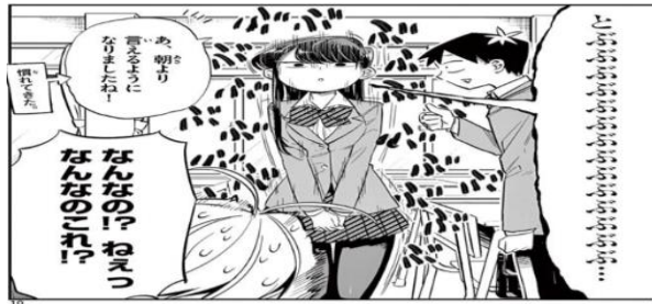
Gambar data 4 Komi tampak gugup dan kesulitan berbicara

“Kecemasan” juga dapat menghambat komunikasi yaitu kesulitan dalam memahami dan menggunakan bahasa serta kesulitan dalam melakukan pembicaraan, artikulasi (suara-suara untuk berbicara)” (Jeffry, 2007:176). Gambar data 4 memperlihatkan Komi kesulitan berbicara saat ingin mengenalkan diri kepada Najimi. Ditandai dengan kalimat “とぶつぶ” yang seharusnya “友だちになってください” (tolong bertemanlah dengan ku). Komi yang mengalami kesulitan berbicara merupakan salah satu ciri simtom perilaku. Dalam kasus Komi, hal ini terjadi disebabkan oleh rasa tertekan dalam situasi yang berhubungan atau berinteraksi dengan orang asing. Ini Menandai ketakutan atau kecemasan terhadap satu atau lebih situasi sosial di mana individu terlihat oleh pengamatan yang mungkin dilakukan oleh orang lain. Contohnya termasuk interaksi sosial “melakukan percakapan, bertemu orang asing”, merasa diamati “makan dan minum”, dan tampil di depan orang lain “memberi pidato” (Maslim, 2013).