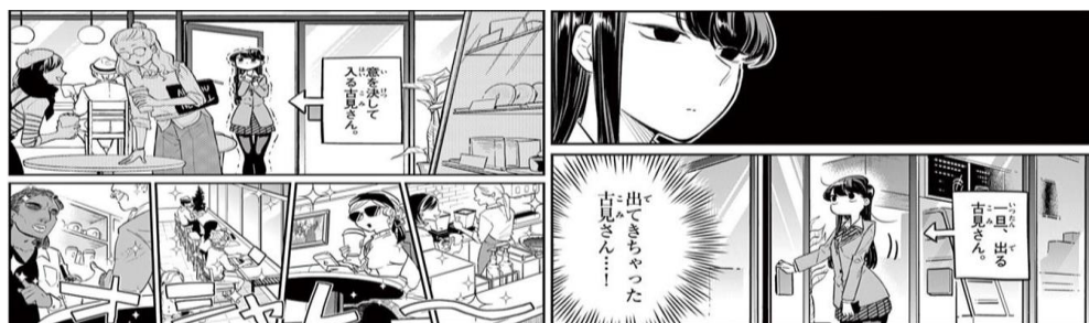
Gambar 8 Komi keluar masuk Stanbakes

Gambar di atas memperlihatkan Komi melakukan penghindaran, karena saat dia memasuki Stanbakes ia sempat keluar karena melihat keramaian, tapi akhirnya ia masuk lagi. Hal tersebut menunjukkan bentuk penghindaran akibat rasa takut akan keramaian dan interaksi sosial. Menurut buku Social Anxiety Disorder Recognition, Assessment and Treatment menyatakan bahwa kapan pun memungkinkan, orang dengan gangguan kecemasan sosial akan berusaha menghindari situasi yang paling mereka takuti. Seperti yang terlihat pada gambar di atas. Peilaku menghindar termasuk dalam simtom perilaku pada individu yang mengalami kecemasan sosial dan ini disebabkan karena terdapat keramaian pada tempat umum yaitu kafe.