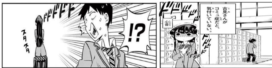
Gambar data 3 Komi menghindari Tadano

Skrip data 3 menunjukkan bahwa perkataan Tadano tidak dibalas atau diabaikan oleh Komi, itu terjadi pada saat hari di mana mereka pertama kali bertemu saat baru memasuki sekolah menengah atas dan Tadano mengajak bicara Komi. Berikut merupakan gambaran yang memperlihatkan Komi sedang menghindari Tadano.