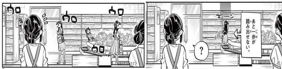
Gambar 12 Komi sedang mondar-mandir di dalam perpustakaan

Gambar diatas memperlihatkan memperlihatkan Komi yang sedang gelisah, kegelisahan tersebut dari tingkah laku pada Komi yang berjalan kesana-kemari tanpa tujuan, ditandai dengan onomatope “ウロウロ” yang mengartikan berjalan kesana-kemari dengan kebingungan dalam kamus elektronik Japanese Onomatopoeia Dictiona (2021), kemudian duduk dan membaca buku sejenak untuk menenangkan diri. Ini termasuk dalam simtom perilaku, hal tersebut merupakan reaksi yang ditunjukkan akibat adanya ketakutan yang Komi rasakan ketika hendak pergi ke meja petugas untuk meminjam buku. Mayo (2018:4) menyatakan bahwa ada beberapa ciri-ciri dan simtom kecemasan salah satunya yaitu merasa gugup, gelisah atau tegang. Hal ini menunjukkan salah satu ciri-ciri gejala gangguan kecemasan sosial karena Komi memiliki ketakutan yang berlebih pada tempat-tempat umum yang melibatkan interaksi sosial.