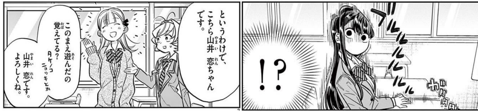
Gambar 5 Komi terlihat takut dan gemetar saat disapa Yamai

Gambar di atas memperlihatkan Komi gemetar saat Najimi memperkenalkan Yamai kepadanya. Diperjelas dengan adanya onomatope “ブルルル／ブルブル” yang mengartikan keadaan tubuh yang gemetar karena kedinginan atau ketakutan. Dalam hal ini merujuk pada Komi yang gemetar karena ketakutan, ini termasuk simtom somatik. Berman & schneier (2004:19) mengatakan bahwa simtom somatik meliputi wajah merona dan berkeringat merupakan gejala somatic yang paling umum, dengan palpitasi, gemetar, dan ketegangan otot, juga dapat berupa serangan kepanikan. Dalam hal ini Komi gemetar karena dipengaruhi aspek tertekan yang disebabkan berhubungan atau berinteraksi dengan orang lain yaitu Yamai.