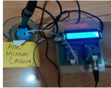
Gambar 3 Pengujian dengan air aqua

Pengujian hardware pada sensor ph air bertujuan untuk pengkondisian kualitas air secara otomatis dengan cara mengukur pH pada air yang berbeda. Air aqua, PDAM, Air garam.