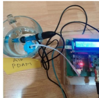
Gambar 4 Pengujian dengan air pdam

Pada pengujian gambar di atas memperlihatkan alat sedang bekerja bahwa sensor tersebut membaca keseluruhan dari mulai pH,suhu,kekeruhan. Pada pengujian tersebut sensor mendeteksi pH sebesar 7.99 yang artinya kualitas air ini baik untuk dikonsumsi.