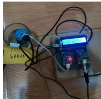
Gambar 5 Pengujian dengan air garam

Sensor pH membaca nilai pH sebesar 7.41 pada air pdam. Sensor kekeruhan menunjukkan bahwa nilai pada kekeruhan air pdam sebesar 2.70.