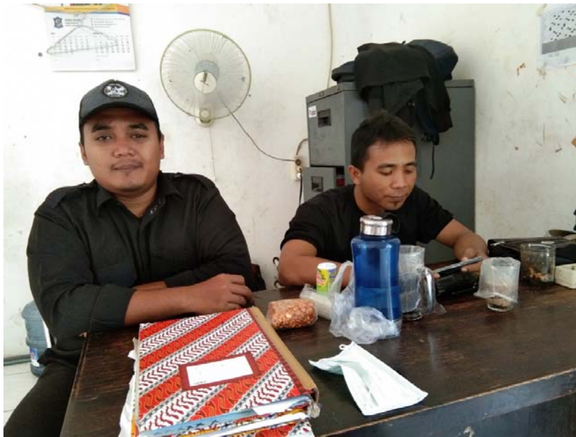
Gambar 8 : Pegawai Ketertiban UPTD Lingkungan Pondok Sosial Keputih