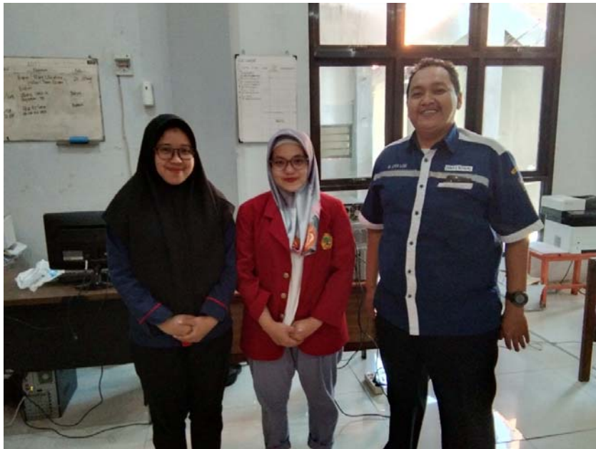
Gambar 7 : Foto Bersama Pegawai UPTD Lingkungan Pondok Sosial Keputih