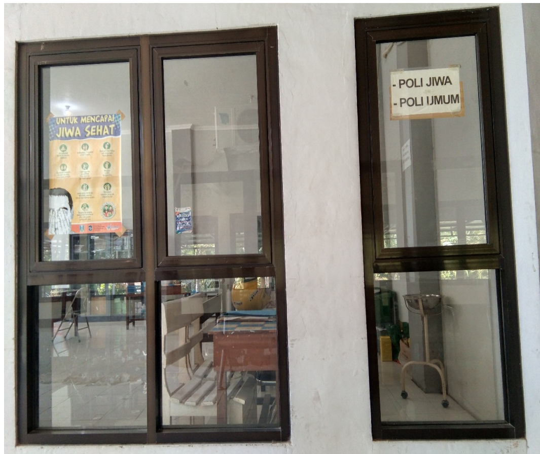
Gambar 1 : Poli Klinik UPTD Lingkungan Pondok Sosial Keputih