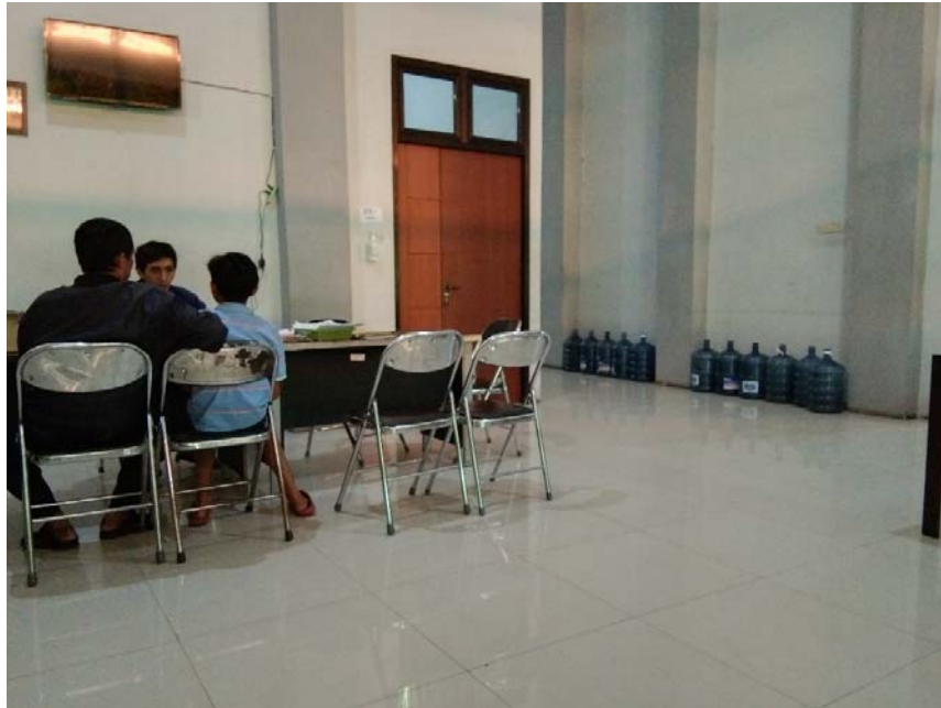
Gambar 3 : Pegawai Sedang Menerima Pengamen Yang Dirazia