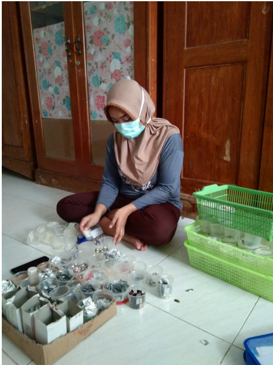
Gambar 2 : Pegawai Kesehatan UPTD Lingkungan Pondok Sosial Keputih