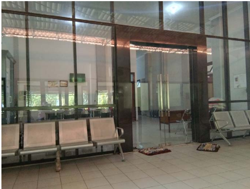
Gambar 4 : Kantor UPTD Lingkungan Pondok Sosial Keputih