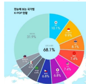
Gambar 1.3 2019 Global K-Pop Map

setelah Korea Selatan. Dengan presentase,