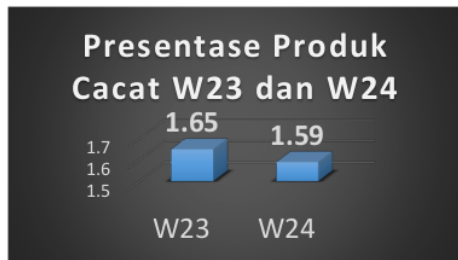
Gambar 1. Persentase Produk Cacat W23 dan W24

Gambar 1. menunjukkan bahwa persentase produk cacat pada output produksi minggu ke 3 dan 4 bulan juni 2022 belum memenuhi target dari perusahaan yaitu maksimal sebesar 1,5% sehingga pada tahap ini perlu dilakukan tindakan perbaikan ulang untuk menurunkan presentase produk cacat menggunakan metode PDCA kembali.