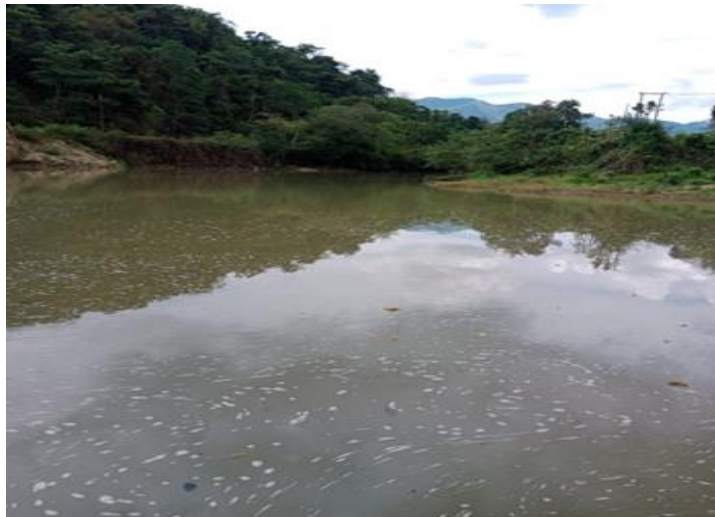
Air baku sungai Wae Mese