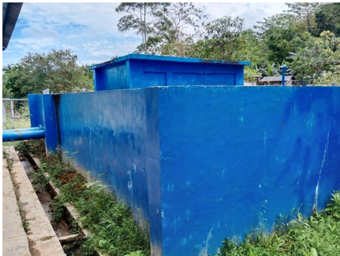
Reservoir IPA Wae Mese I