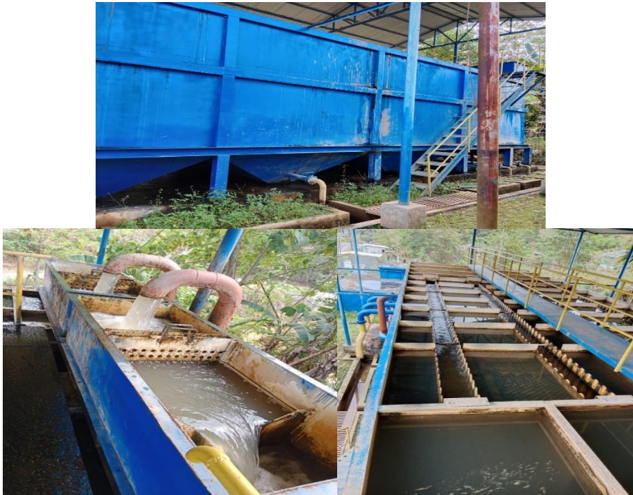
Unit IPA Wae Mese I