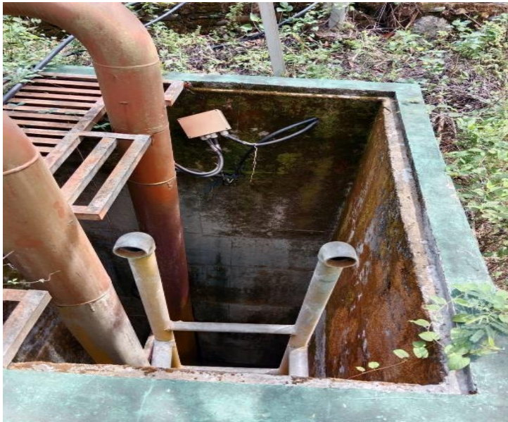
Sumur pengumpul intake