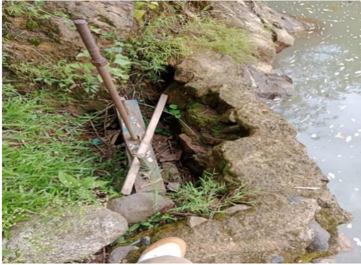
Bar screen intake