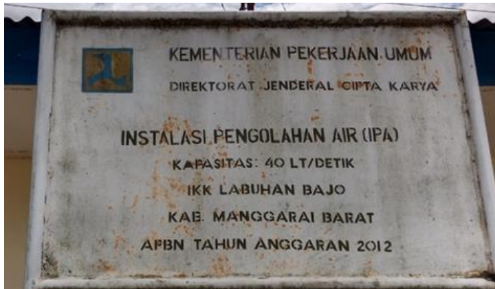
Kapasitas Produksi IPA Wae Mese I