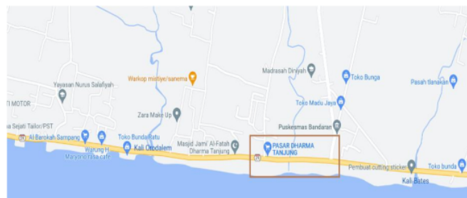
Gambar 2. Peta Lokasi Penelitian

Penelitian dilakukan sepanjang pasar tradisional Tanjung Camplong yang terletak di Kelurahan Tanjung, Kecamatan Camplong, Sampang, Jawa Timur