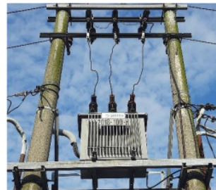
Gambar 2. 1 Transformator Distribusi

Transformator memiliki peran yang penting dalam sistem penyaluran energi listrik dari awal pembangkit sampai ke sebuah industri ataupun rumah tangga. Transformator bekerja secara elektrik magnet yang sangat efisien dalam penyaluran tegangan dari tegangan satu ke tegangan yang lain, dari tegangan rendah ke tegangan tinggi begitu pula sebaliknya. Pada transformator terdapat lilitan yaitu lilitan pada kumparan primer dan sekunder disesuaikan sesuai dengan kebutuhan untuk menaikkan tegangan atau untuk menurunkan tegangan [1]