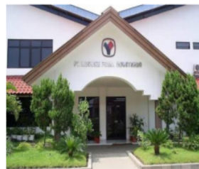
Gambar 3.2 PT. Indowire Prima Industrindo

Penelitian bertempat di Jl. Margomulyo Indah No.C-1, Buntaran, Kec.Tandes, Kota SBY, Jawa Timur 60185.