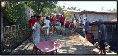
Gambar 04 Dokumentasi Pengerjaan Akses Jalan pada Desa Wisata Detusoko