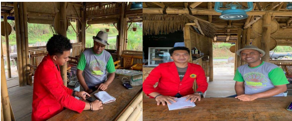
Gambar 01 Keterangan Dokumentasi Wawancara Bersama Kepala Desa Detusoko