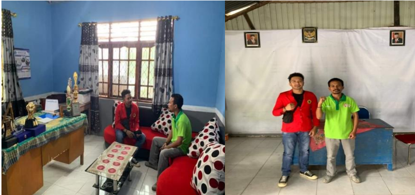
Gambar 02 Keterangan Dokumentasi Wawancara Bersama Sekretaris Desa Detusoko