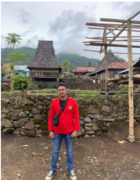
Gambar 03 Keterangan Dokumentasi Lokasi Wisata Budaya Desa Detusoko