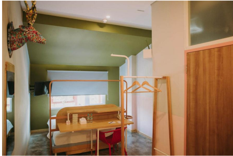
Sumber : hotel Pana House