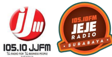
Perubahan logo jeje radio di tahun 2012

Jeje Radio Surabaya telah mengudara selama 21 tahun. Jeje Radio telah berdiri sejak 28 Februari 2001 di bawah naungan PT Radio Wahana Informasi Gemilang. Awalnya objek penelitian radio ini menggunakan nama Radio JJ FM Surabaya dan kemudian berganti menjadi Jeje Radio. Dulu jargon atau slogan JJ Radio yang paling terkenal adalah The Radio For The Bussines People karena segmentasi audiens Radio JJ FM mencakup kalangan pebisnis yang berusia 20-40 tahun kemudian melakukan rebranding pada tahun 2010 Jeje Radio Surabaya dengan slogan " Hits Up Your Life " segmentasi audiens Jeje Radio berganti menjadi remaja. Segmen sasaran menjadi anak muda merupakan pilihan yang sangat berani karena saat ini di Surabaya banyak radio kompetitor yang hadir dengan competitor yang memiliki segmentasi audiens yang sama antara lain Gen FM, Hard Rock FM, Istara FM dan lain-lain.