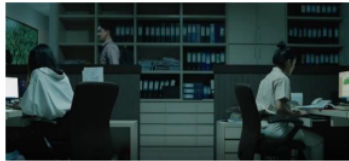
Gambar 1 Scene, Pertama film Please Be Quiet