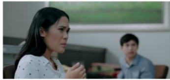
Gambar 3 Scene, Ketiga film Please Be Quiet

menilai kedudukan perempuan lebih rendah daripada laki-laki serta bentuk penolakan merupakan sebuah kemajuan perempuan melawan pelecehan seksual.