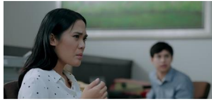
Gambar 3 Scene, Ketiga film Please Be Quiet

menilai kedudukan perempuan lebih rendah daripada laki-laki serta bentuk penolakan merupakan sebuah kemajuan perempuan melawan pelecehan seksual.