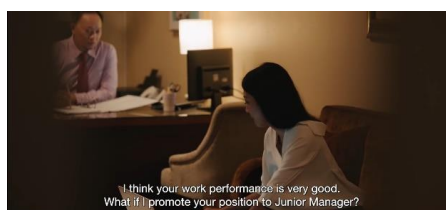
Gambar 2 Scene, Kedua film Please Be Quiet

Adegan pertama yang dianalisis dalam film tersebut adalah adegan yang menunjukkan bahwa perempuan tidak memiliki kualitas kepemimpinan. Sebagai masyarakat yang bersifat patriarki, sulit bagi perempuan untuk mengembangkan bisnis melalui karir.