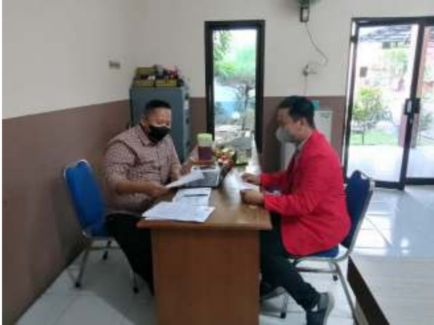
Lampiran.1 Foto Wawancara